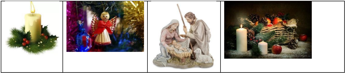
А) Новый год