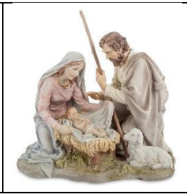
Б) Рождество Христово