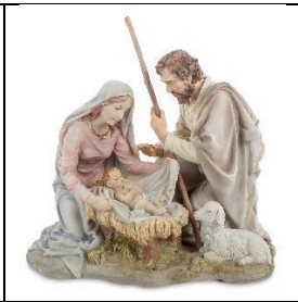
Б) Рождество Христово